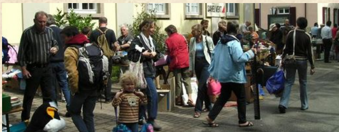
Flohmarkt der Baptistengemeinde in Freiburg