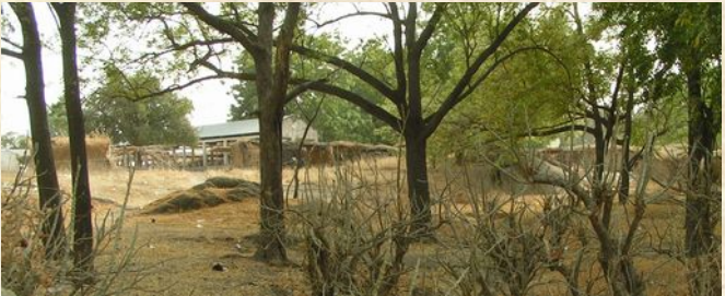
Pflanzung direkt neben dem Markt von Dagai