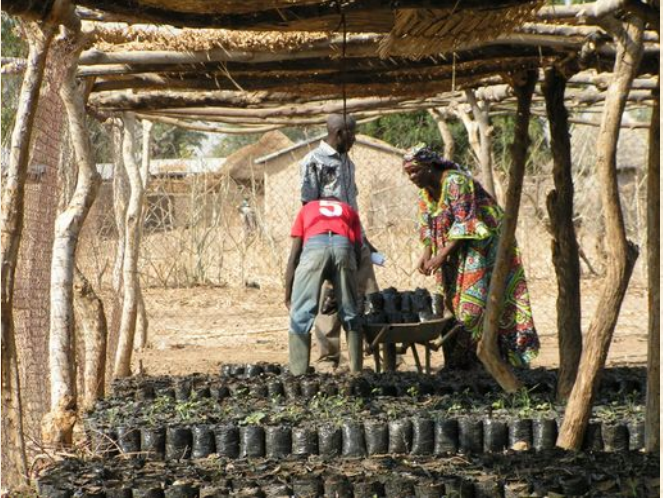
Heranziehen von Setzlingen in der Baumschule.