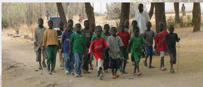
Grundschulklasse auf dem Schulgelände in Dagaï

Das Projekt Sahel Vert ist ein Baumpflanzprojekt, bei dem durch die einheimische Bevölkerung - vornehmlich Schüler und Schülerinnen der weiterführenden Schulen - Bäume gepflanzt werden. Gleichzeitig verdienen sich die Jugendlichen damit ihr Schulgeld, so dass das Projekt auch zu ihrer Schulbildung beiträgt.