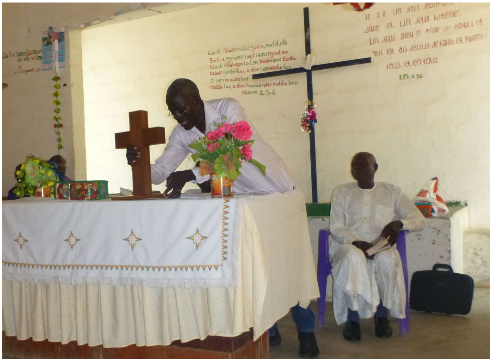
Gottesdienst in der Baptistengemeinde Dagai - mit dem Kreuz aus Freiburg

Im Anschluss an den Gottesdienst sind wir eingeladen zum einem gemeinsamen Mittagessen.